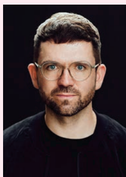
Nicholas Potter

Jüdisches Gemeindezentrum, St.-Jakobs-Platz 18, 80331 München