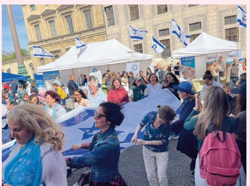
Israel-Tag 2023

*mit freundlicher Unterstützung des Zentralrats der Juden in Deutschland