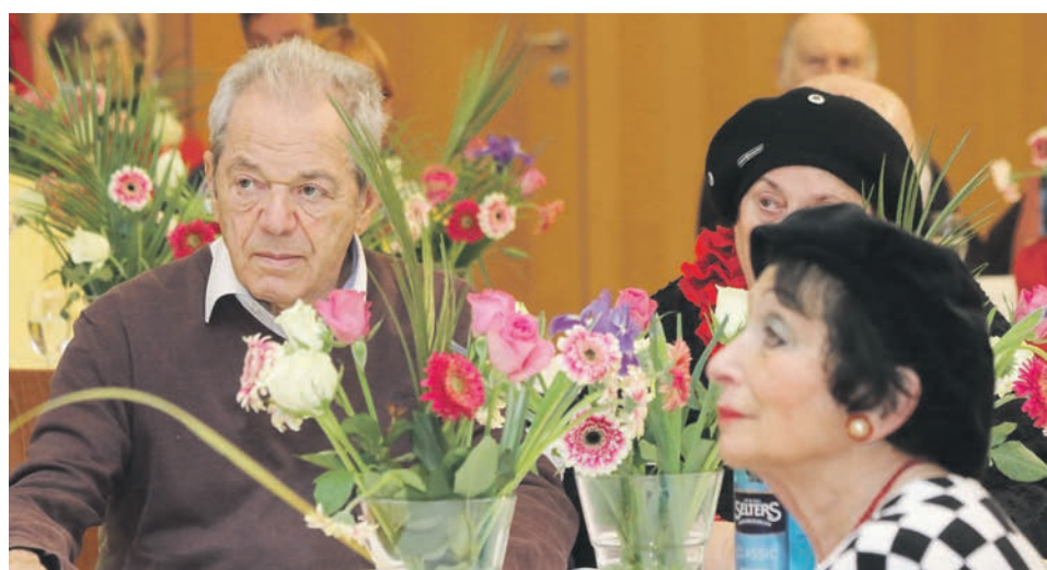
Fünf Jahre Café Zelig wurden im Hubert-Burda-Saal gebührend gefeiert.

Ein Glanzpunkt war die Vorführung des Films Das Zelig von Tanja Cummings, der die Geschichte des Treffpunkts erzählt und bereits als Beitrag zu den 12. Jüdischen Filmtagen gezeigt wurde. Helmut Reister