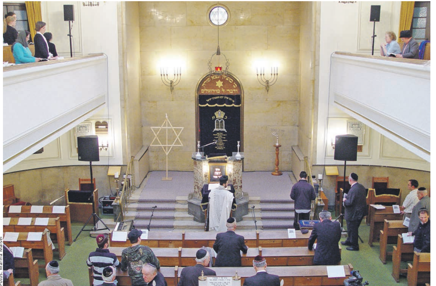
Beter in der Synagoge an der Reichenbachstraße, die von 1947 bis 2006 Münchens Hauptsynagoge war

Mit seiner Spende will der Fußballklub ein wichtiges gesellschaftliches Signal aussenden, ebenso wie mit der Anerkennung der Antisemitismusdefinition der International Holocaust Remembrance Alliance. Die IHRA-Definition wurde 2016 beschlossen und seither von 34 Staaten sowie dem Europäischen Parlament angenommen. 2017 folgte der Deutsche Bundestag und im Anschluss daran auch die Bayerische Staatsregierung. Im Freistaat gilt die Definition als Arbeitsgrundlage