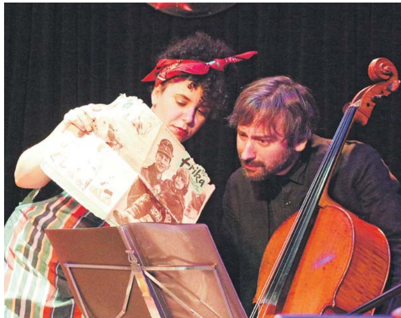
Beim Europäischen Tag der jüdischen Kultur dabei: »The Third Generation Cabaret«

Zum Programm des Europäischen Tages der jüdischen Kultur gehört auch in diesem Jahr ein Stadtrundgang durch die