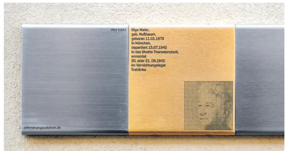
Erinnerungszeichen in der Arcostraße 1