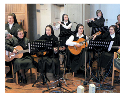
Schwesternband © Angerkloster