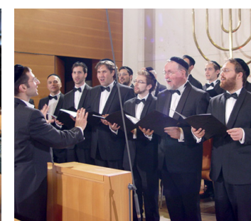
Synagogenchor Schma Kaulenu