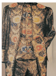
Herrenkleid – Empire 1815 © Haute Couture Ralf R. Stegemann