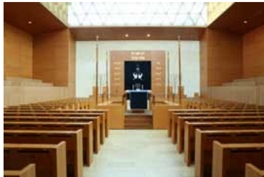
Blick in das Innere der Synagoge

Neshama : Vielen Dank, dass Sie sich für das Gespräch Zeit genommen haben.