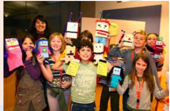
2009. Kinderuni