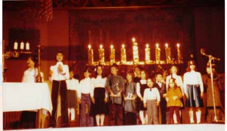
1975. Chanukafest 5736 im Künstlerhaus