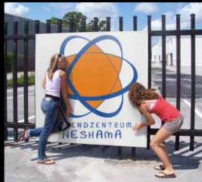
What we would like to do