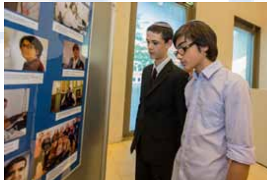
2012. Fotoausstellung im Foyer des Gemeindezentrums