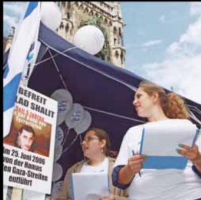
What the jewish community thinks we do