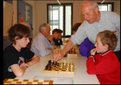
What our parents think we do