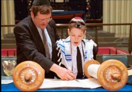
What the rabbi thinks we do