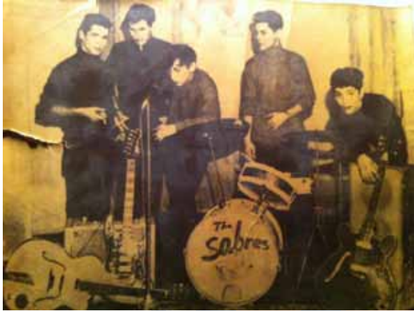
1963. „The Sabres“ im Club Maon Hanoar