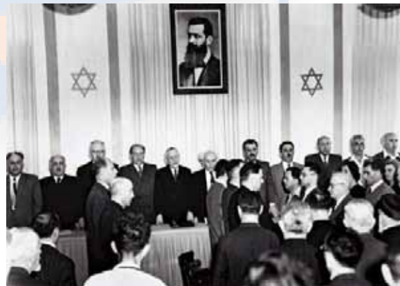
1948. Gründung Israels