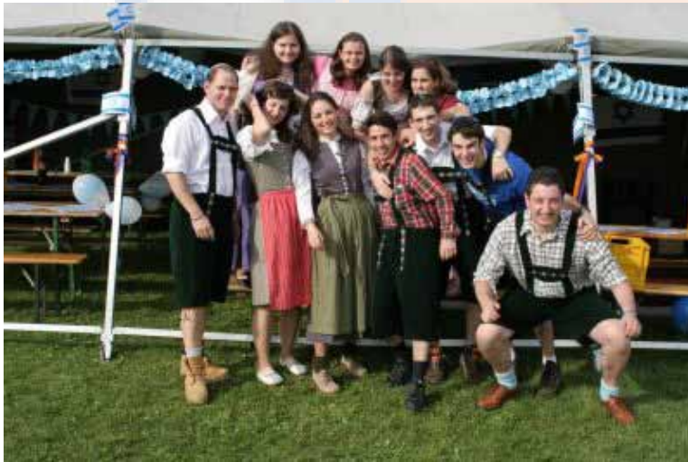
2008. Oktoberfest