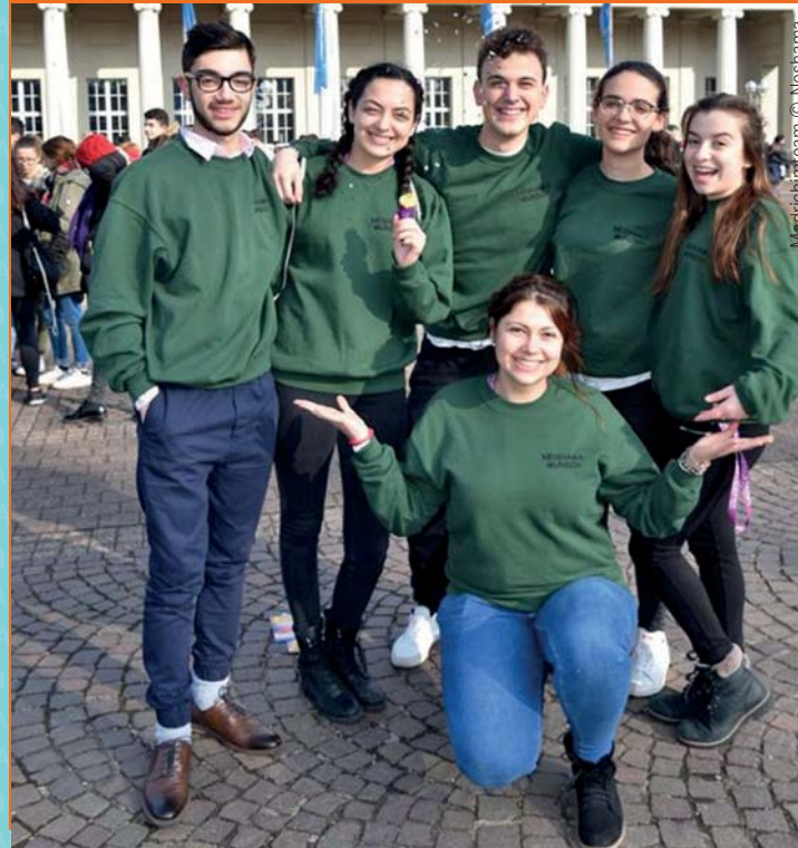
Madrichimteam © Neshama

12.03.; 19.03.; 26.03.; 02.04.; 07.05.; 21.05.; 28.05.; 25.06.; 02.07.; 09.07.; 16.07.; 23.07.