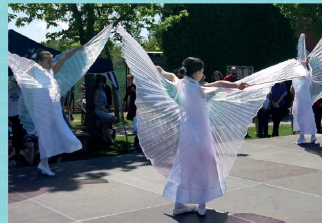
»Genesis«-Auftritt beim Maccabi-Sportfest 2016.

Für die »18+«-Gruppe bieten wir »Kommen & Mitmachen«-Stunde: es gibt die Gelegenheit mitzutanzten, zuzuschauen oder einfach zu genießen. Wir hoffen möglichst viele Interessierte und Neugierige, Musik- und Bewegungsbegeisterte zu begrüßen.