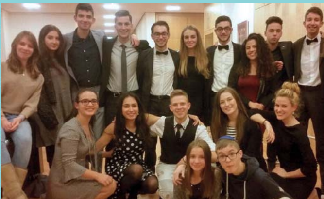
Jugend Kabbalat Schabbat.

Alle ab 12 Jahren sind eingeladen einen Abend mit leckerem Essen, Gebet, Singen, Spielen und vielem mehr zu verbringen. Lass dich von der magischen Shabbes Stimmung verzaubern und erlebe diesen besonderen Abend mit deinen Freunden und deiner Neshama-Familie.