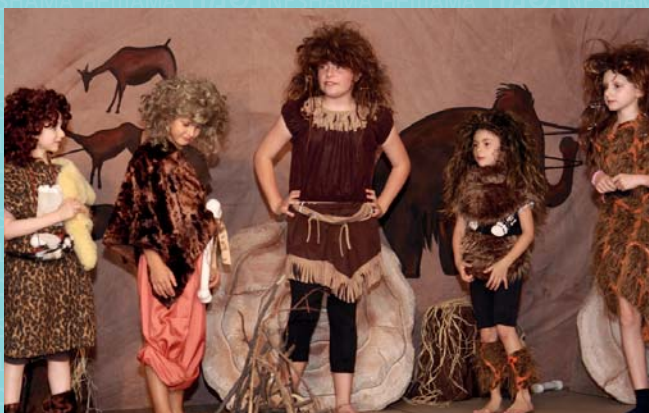
Szenenbild »Das sind wir«, 2010.

Alles startet irgendwie und irgendwann! Und so startet auch die Kindertheatergruppe von Lo-Minor ihren Weg in die großartige Welt des Theaters. Mit dem Stück »Das sind doch wir!« begeben sich die jungen Schauspieler auf die Suche nach Antworten auf die Fragen: Wer hat was erfunden? Wie war es früher? Wie sieht die Zukunft aus? Eine turbulente Komödie, in der es sich um Ur-menschen handelt, erzählt die Geschichte, wie ALLES angefangen hat. Das erste Feuer, die erste Hochzeit, das erste Theater. Ob Ihr Euch die Vergangenheit auch so vorgestellt habt? Kommt einfach zu unserer Vorstellung und überzeugt euch selbst!